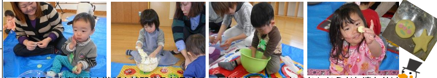
1・2歳児の小麦粉粘土遊び!綺麗な色を混ぜて、大きなボールでこねこねしたらお友達と分け合って遊びます。作った形が余り美味しそう思わずモグモグとお口を動かしている姿も見られました。また、0歳児は初めてのお絵描きごっこ、どちらもママが夢中になっていましたよ!!