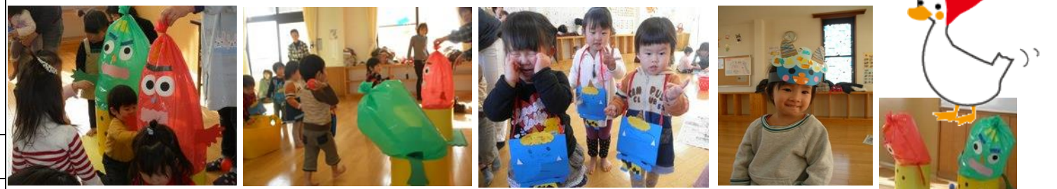
各クラスで行われた「節分ごっこ」。毎年センターにやって来る怖〜い鬼に泣き出すチビツ子達の為に、今年は可愛いユラユラ鬼の登場に大喜びでボールを投げていました。